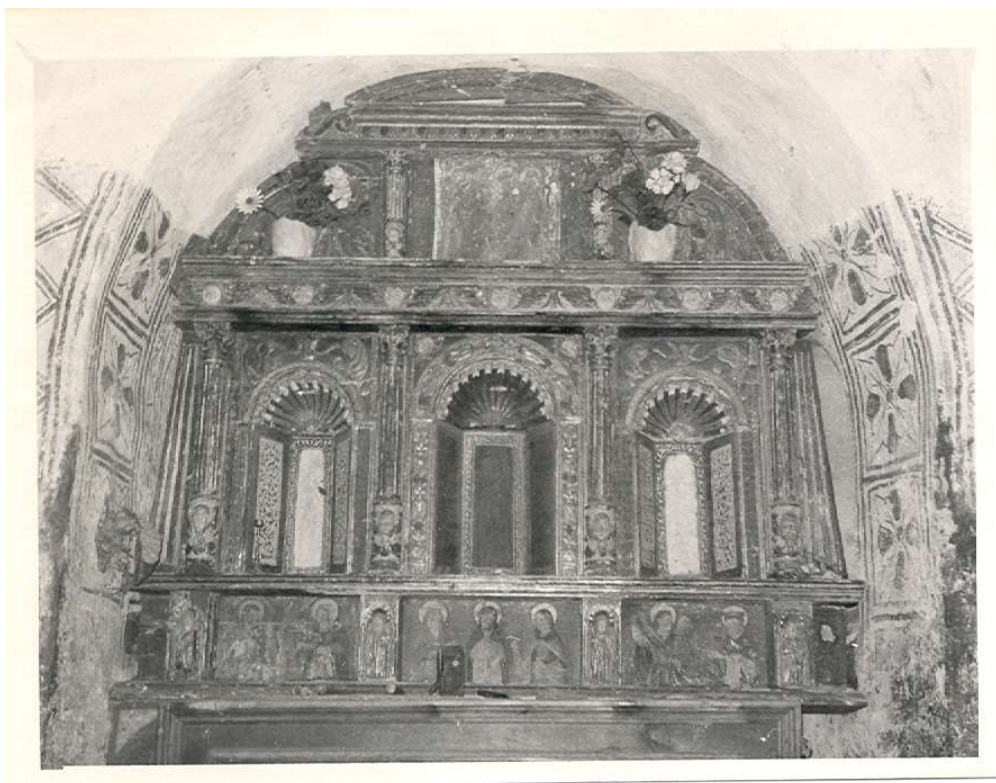
Retaula de Sant Serni de Nagol

La predel·la es troba en mal estat. Presenta brutícia, pèrdues de suport, de la capa de preparació, de la capa pictòrica i de la de daurat, aixecaments, desgast, esquerdes, atac de xilòfags, taques d'humitat i oxidació dels claus.